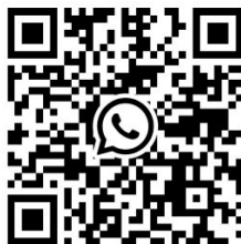
TABLEAU OFFICIEL REGATES

Le tableau officiel d'information en ligne est consultable à l'adresse www.iych.fr et sur le groupe WhatsApp https://chat.whatsapp.com/K3YqnFhGbjx92V2o0P99br?mode=hqrc